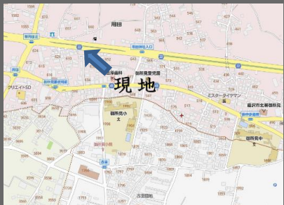
【ナビ: 藤沢市用田634-1付近】