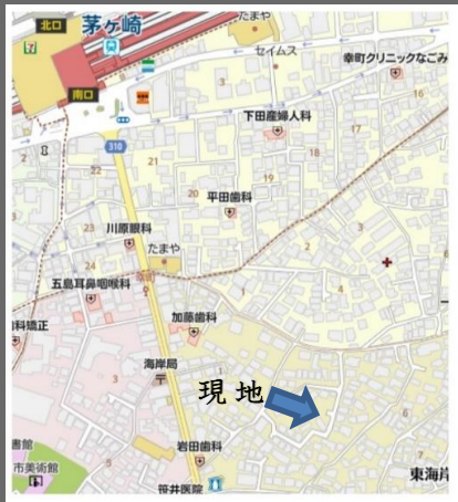
【ナビ: 茅ヶ崎市東海岸北2-2-25】