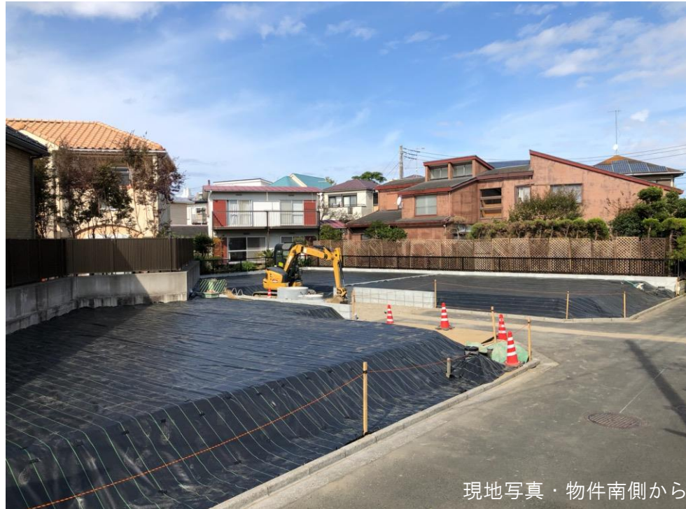
現地写真・物件南側から