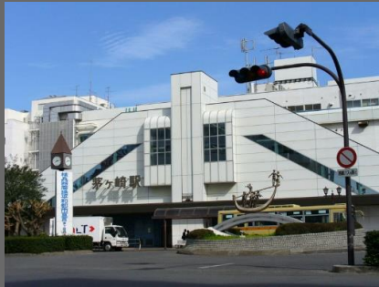
【茅ヶ崎駅まで徒歩5分】