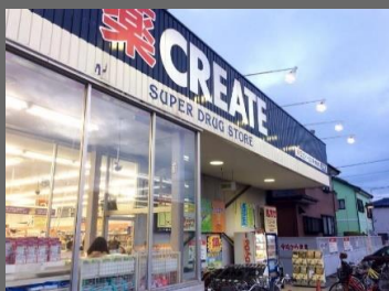
CREATE松林店まで徒歩2分