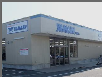
ヤマカ松林店まで徒歩5分