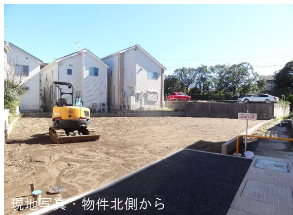
現地写真・物件北側から