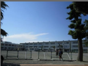
松林小学校まで徒歩8分