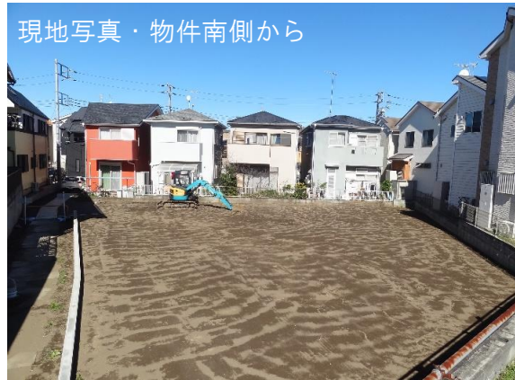
現地写真・物件南側から