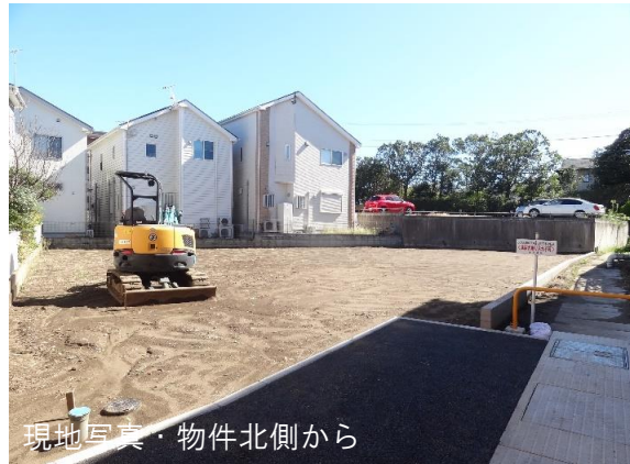
現地写真・物件北側から