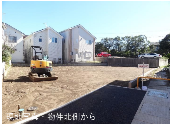
現地写真・物件北側から