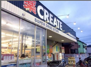
CREATE松林店まで徒歩2分