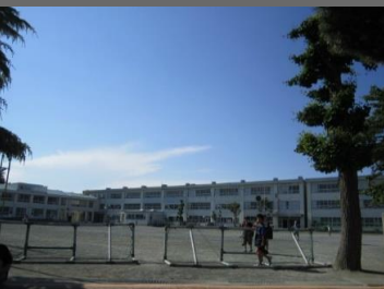
松林小学校まで徒歩8分