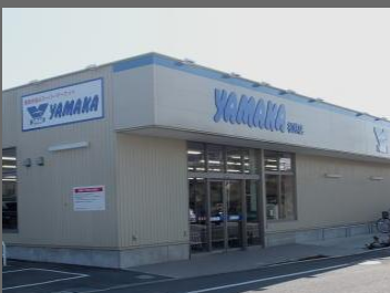
ヤマカ松林店まで徒歩5分