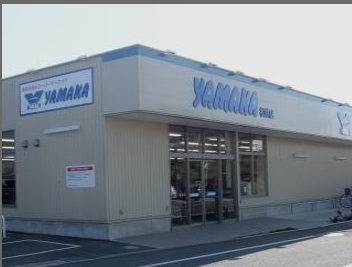
ヤマカ松林店まで徒歩5分