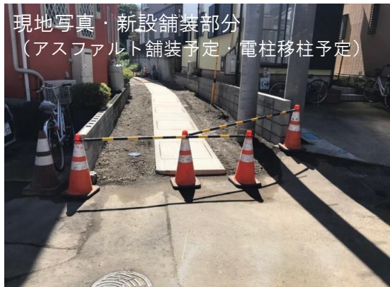
現地写真・新設舗装部分 (アスファルト舗装予定・電柱移柱予定)