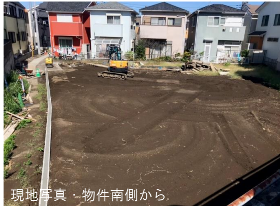
現地写真・物件南側から