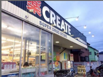
CREATE松林店まで徒歩2分