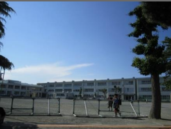
松林小学校まで徒歩8分