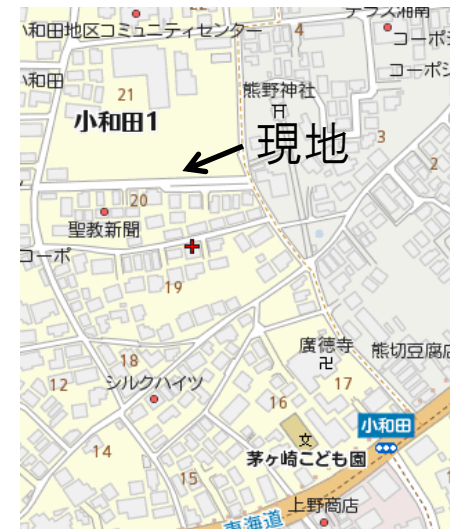
【カーナビ：小和田1-21付近】

【ハイレベルな標準設備・仕様】 へーベルパワーボード・トクラスシステムキッチン（カップボード・食洗器付） トクラスユニットバス・LOW-E複層ガラス（一部電動シャッター付） タッチキー玄関ドア（リモコン付）・オーデリックLED照明一部装備 地震・台風に強いP&CMJシステム工法